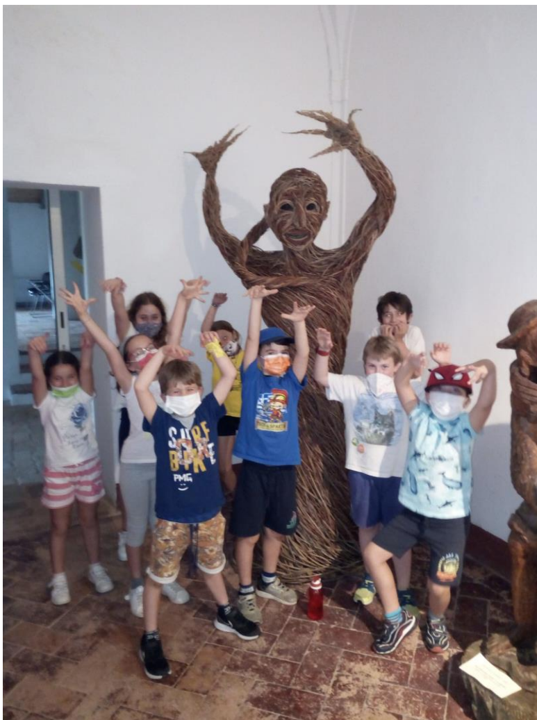
La gioia di ritrovarsi, espressa dai bambini dei gruppi estivi elementari ACR e ANSPI.